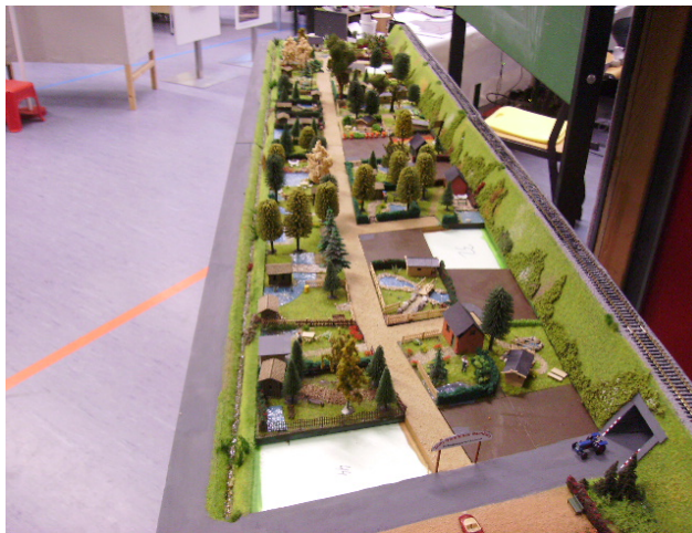
Voorbeeld van volkstuintje met nog enkele open plaatsen