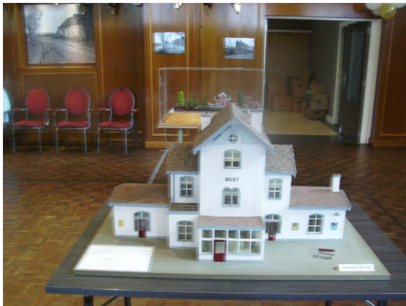
Het grotere broertje of zusje, schaal 1 : 29

De Heemkundekring Best had een tentoonstelling georganiseerd in het Prinsenhof waar de EMV bij was uitgenodigd. De Heemkundekring had een grote foto expositie in de zaal opgesteld en de EMV was met het Scholenproject en de N-baan plus demonstratie van bomen maken in een zij zaal aanwezig. In de grote zaal stond ook de maquette die wij voor de Heemkundekring Best van het station Best uit ±1915 hadden gemaakt, schaal 1:87. Maar er was ook nog een zusje of broertje aanwezig die groter was, namelijk 1:29, dus drie keer zo groot. Gemaakt door de heer van Hoof.