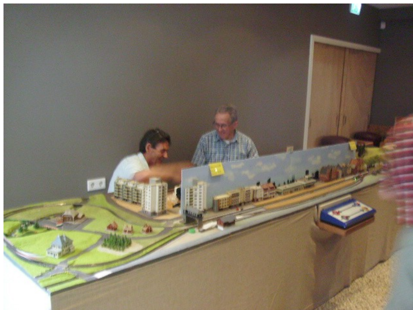
In een koele gang van het Prinsenhof staat de N-baan opgesteld.

De bomenkwekerij van hovenier Kriele vond ook bij de oudere aftrek. Zo als het spreekwoord luidt: oud geleerd jong verleerd!