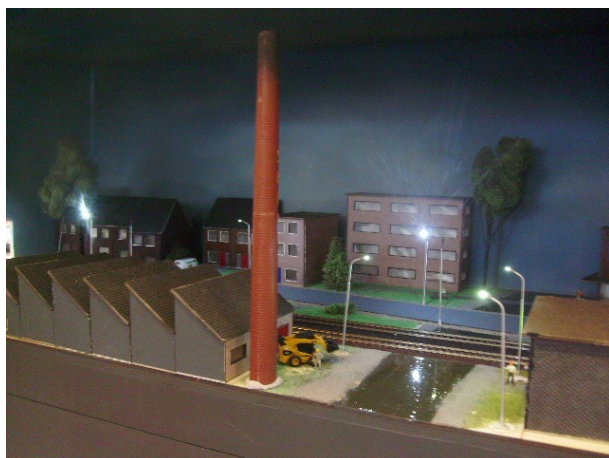
De nacht situatie

En de prijswinnaar is de Emmanuëlschool in Best. Gelukkig waren er afgevaardigden van die school, een zestal leerlingen, die de prijs in ontvangst konden nemen. En de gelukkigen gaan met de trein naar het Spoorwegmuseum in Utrecht. Dat zal nog een hele onderneming worden met zo'n klas.