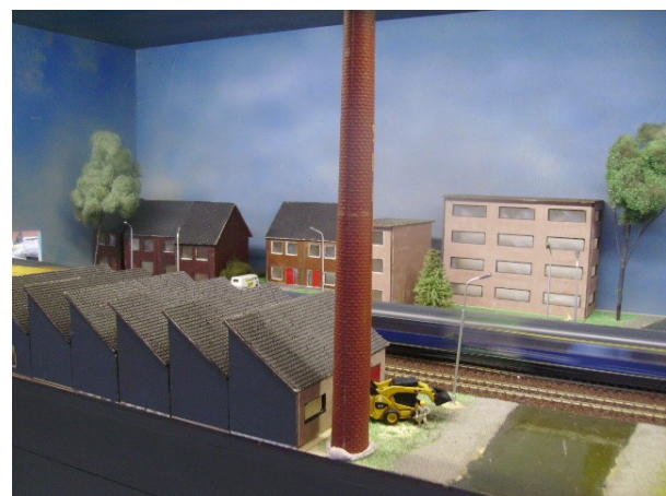
De dag situatie