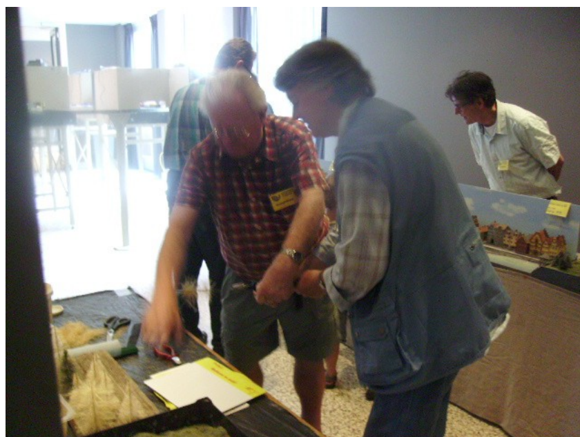
Onder deskundige leiding komt de boom tot stand.

De bomenkwekerij van hovenier Kriele vond ook bij de oudere aftrek. Zo als het spreekwoord luidt: oud geleerd jong verleerd!