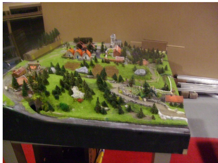
Gemaakt door Karel Beugelaar