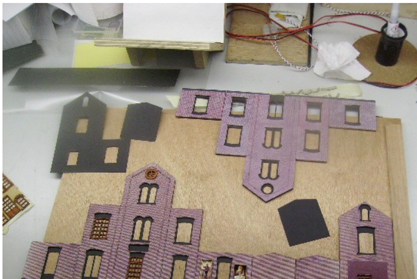
Station Best in wording

Aan dit project wordt volop gewerkt zodat het klaar is op 9 juli a.s. Het staat dan opgesteld in de Prinsenhof in Best.